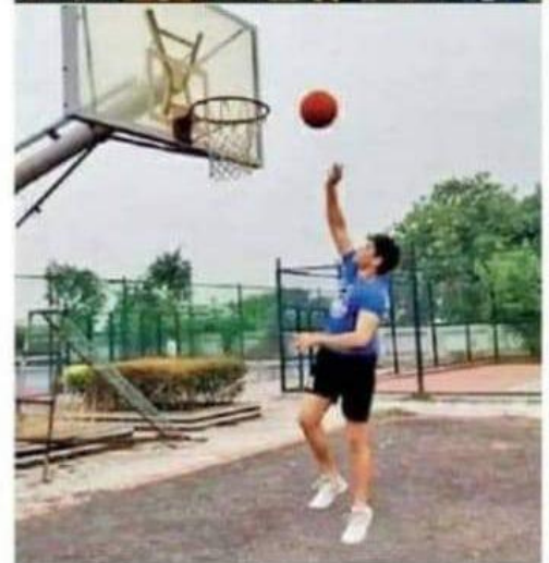
इंदौर • डीबी स्टार

डेली कॉलेज ऑफ बिजनेस मैनेजमेंट (डीसीबीएम) में टैलेंट हंट 'सर्वोपर फेयर' का आयोजन किया गया। इस प्रोग्राम में छात्रों को अपनी प्रतिभा दिखाने के लिए ऑनलाइन मंच प्रदान किया गया। इसमें कई श्रेणियां थीं, जैसे- संगीत, नृत्य, पाक कला, नाट्य कला, साहित्यिक अभिव्यक्ति और खेल। मूल्यांकन पांच मानदंडों के आधार पर किया गया- रचनात्मकता, मौलिकता, प्रस्तुतिकरण, मनोरंजन और ओवरऑल इंपैक्ट।